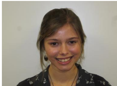
Margot Ledoux : « Ce sont toujours les cons qui l'emportent. Question de surnombre. » Frédéric Dard